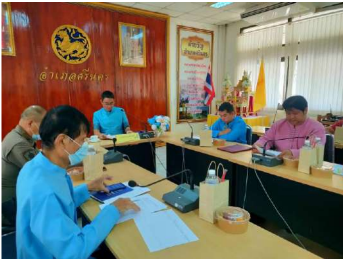
ภาพประกอบการประชุมคณะกรรมการพัฒนาคุณภาพชีวิตระดับอำเภอ อำเภอศรีนคร จังหวัดสุโขทัย วันที่ ๒๑ เมษายน ๒๕๖๖ ห้องประชุมที่ว่าการอำเภอศรีนคร